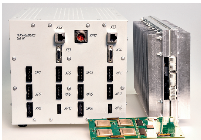
Рис.1. Высокоскоростной многокластерный интегрированный модуль обработки данных

антеннами, систем радиоизмерений и т.д.), могут применяться в системах управления транспортными, авиационно-космическими и энергетическими комплексами. Высокоскоростной многокластерный интегрированный модуль обработки данных состоит из базовой платы (с возможностью установки на нее до пяти субмодулей) и представляет собой моноблок с пассивным воздушным охлаждением, предназначенный для применения в целевом устройстве (ЦУ) – аппаратном комплексе, в составе которого будет эксплуатироваться.